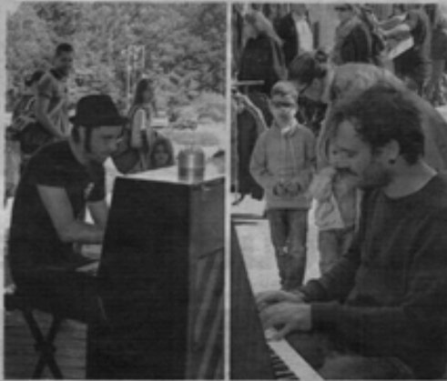
En 2017, des pianos mobiles avaient déjà été disposés dans la ville.

Le départ est prévu devant les portes du jardin « dont les arbres et les allées seront mis en lumière pour l'occasion ». La déambulation doit avoir lieu