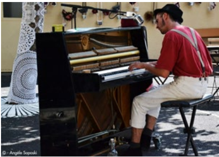
Kasper & son pianomobil (Dordogne)